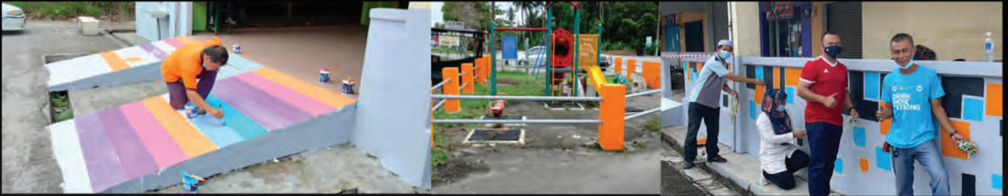
Aktiviti pengindahan dan menceriakan sekitar kawasan Pekan Gopeng pada 15 Mac 2021 yang disertai oleh Tuan YDP, Ahli Majlis serta kakitangan Majlis Daerah Kampar.