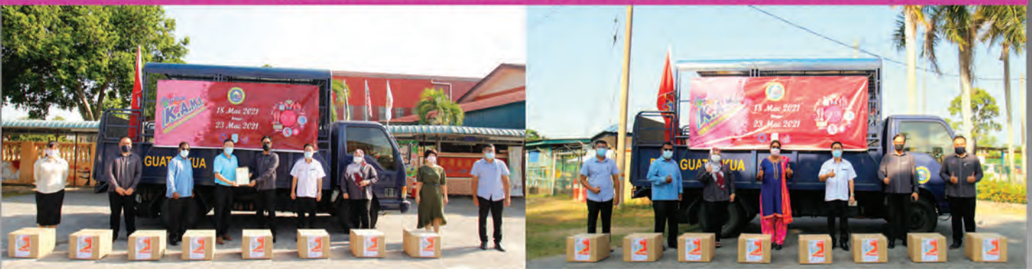
SK GOPENG JALAN ILMU, SJK (T) GOPENG, DAN SJK (C) LAWAN KUDA BARU | 22 MAC 2021