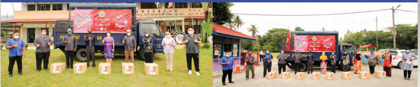
SK MALIM NAWAR, SK TUALANG SERAH, SJK (T) METHODIST, DAN SJK (C) YIN SING | 23 MAC 2021