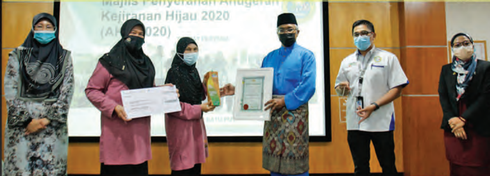
Pemenang Kategori : Komuniti Perumahan Kampung Dalam Bandar Nama Projek : Kebun Kejiranan HELWA RPT Batu Putih

Pada 20 April 2021 bertempat di Auditorium MDKpr telah berlangsung Majlis Penyerahan Anugerah Kejiranan Hijau (AKH2020) bagi Kebun Kejiranan Hijau.