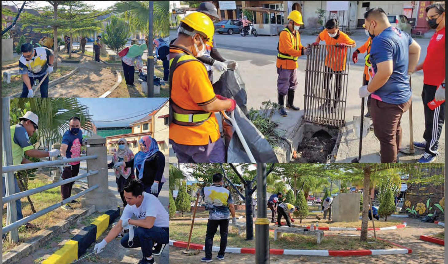
Aktiviti pengindahan dan menceriakan persekitaran Medan Selera Batu Karang telah diadakan pada 12 April 2021 yang disertai oleh Tuan YDP, Puan Setiausaha, Ahli Majlis dan kakitangan Majlis Daerah Kampar.