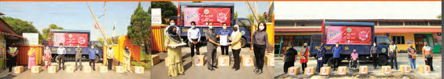
SK DE LA SALLE, SJK(T) KAMPAR, SJK(C) CHUNG HUA DAN SK KAMPAR | 19 MAC 2021

Program K.A.M.I (Kerja Amal Membantu Insan) ialah kerja amal yang bertujuan membantu insan yang terkesan akibat Pandemik Covid-19. Urusetia program ini adalah di bawah Unit Perhubungan Korporat & Hal Ehwal Komuniti MDKpr dengan kerjasama Pejabat Yang Dipertua, Unit Audit Dalam, Koperasi Anggota MDKS Berhad, Kelab Sukan MDKpr dan Badan Kebajikan MDKpr. Penerima adalah terdiri daripada anggota MDKpr seramai 35 orang dan 104 orang pelajar Sekolah Rendah di 13 buah sekolah sekitar Daerah Kampar (Kampar, Gopeng, Malim Nawar dan Mambang Diawan) dengan kerjasama bersama Pejabat Pendidikan Daerah Kinta Selatan. Sumbangan yang diberi adalah berbentuk barangan keperluan harian yang turut disampaikan oleh Ahli Majlis, Majlis Daerah Kampar dengan mematuhi garis panduan panduan dan operasi standard yang ditetapkan. Diharap agar program sumbangan ini dapat meringankan beban dan menceriakan hari penerima sumbangan yang terlibat.